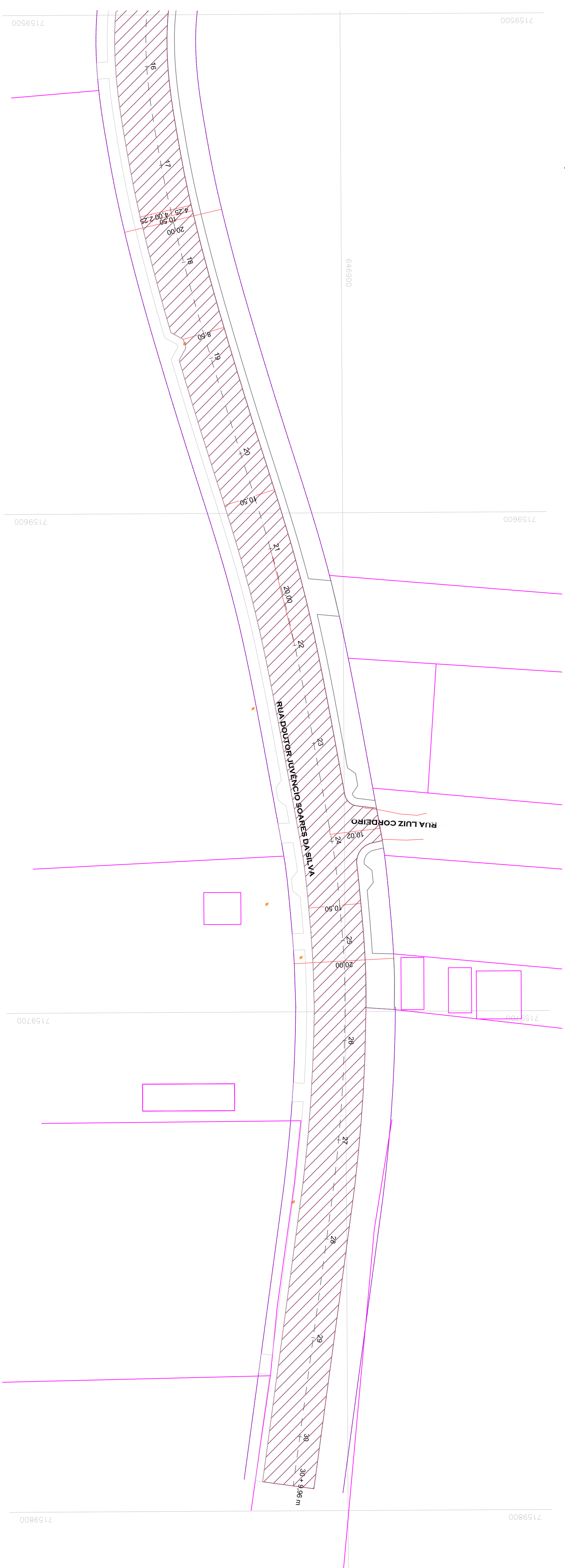
PLANTA DE LOCAÇÃO DA BASE, SUB-BASE E ESCAVAÇÃO ESCALA: 1/500